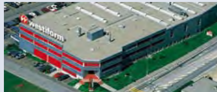
Schweiz: Werk Niederwangen/Bern