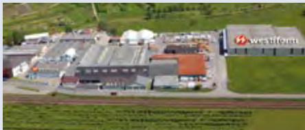
Deutschland: Werk Ortenberg /Baden