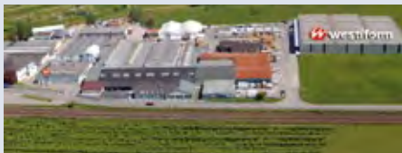
Allemagne: usine d'Ortenberg/Baden

Programmes d'organisation et d'exécution