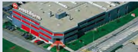
Suisse: usine de Niederwangen/Berne