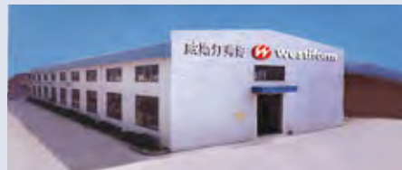
Chine: usine de Shanghai